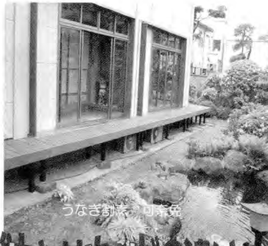
うなぎ割烹 可奈免