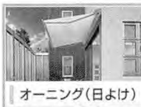
オーニング(日よけ)