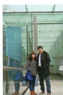
恋人同士のようにツーショット 小さいときは、パパのお嫁さんになると言っていた。