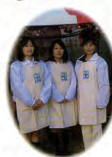
窓ショップ3人娘です。気合を入れて「頑張るぞー!!」直前のパチリ。

トントントン、のこったのこったの掛け声に、ドラえもん関の勝ち。必ず勝てるコツは未だ見つからず。時の「運」かな? 稽古に精進せねば…。