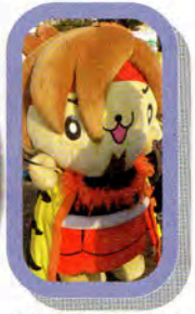
前田慶次のゆるキャラ。けーじろー君も終日活躍しました。かわいいですねえ~