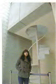
「未来を見つめる乙女」 ポーラ美術館所蔵