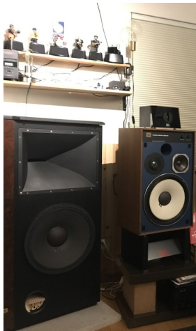
たぶんもうこれで完成