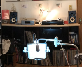
娘の部屋を改造してやっと手にしたオーディオルームの最初の頃