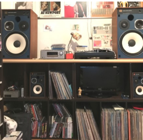
ハードオフの新潟でゲットした大きなJBLと、最初に喜んで聴いていた同じモデルの小さいJBL